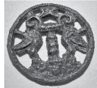
Самое ценное из находок в Слудке. Диаметр с современный пятирублевик, вылитый из свинца. Что это и для чего, выяснить не удалось.

Обратили внимание на небольшой подковообразный уступ в земле как бы с бруствером в сторону дороги. Металлоискатель снова подал прерывистым сигналом признаки «клада». Начали осторожно раскапывать. Сразу же