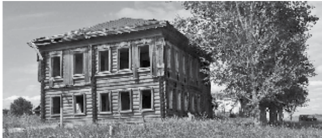
«Поповский» дом в Слудке. 2003 год.

и подвала. В основном это были медные царские монеты достоинством в одну, три, пять копеек. Наш прибор, настроенный здесь на цветные металлы, тоже пищал по-