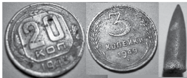
Посерские находки (комментарии не нужны).