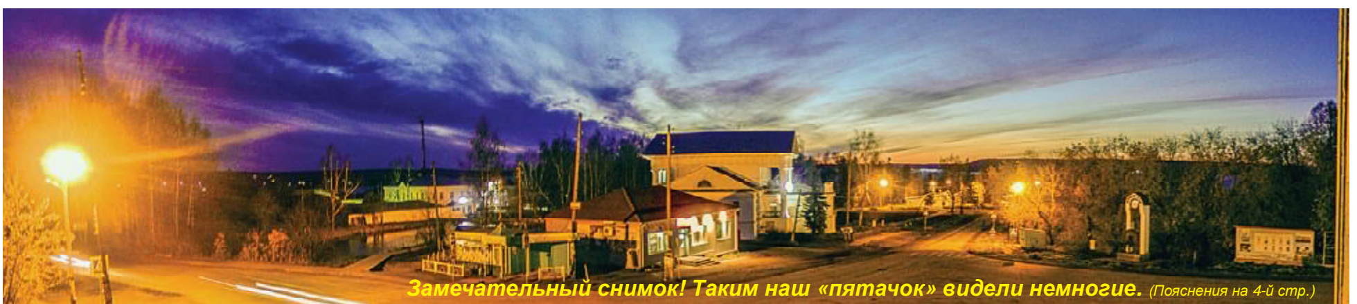
Замечательный снимок! Таким наш «пяточок» видели немногие. (Пояснения на 4-й стр.)