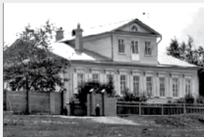
Фото фасада дома, начало XX века.

Дом был построен Строгановыми в 1829 г. и отдан А.Е. Теплоухову в 1861 г. Он оставался во владении его семьи до 1905 г. и был одним из главных культурных центров села. За домом были посажены сад и дендрарий, где проводились опыты по изучению и интродукции новых для данного региона видов растений. Здесь собиралась знаменитая археологическая коллекция. В настоящее время в здании размещается Ильинская центральная районная библиотека.