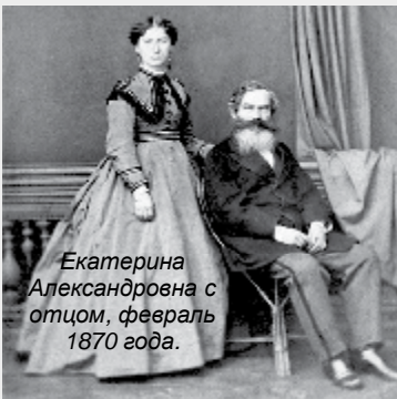
Екатерина Александровна с отцом, февраль 1870 года.

Родилась 8 февраля 1847 г. в Ильинске и скончалась в 1907 г. там же.