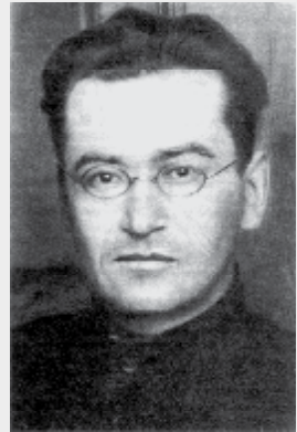
3 марта 1888, Ильинское, Россия - 10 марта 1934, Ленинград, СССР.

Арестован в 1933 г. по «делу Русского музея» – «делу славистов», покончил с собой в камере НКВД в Ленинграде в 1934 г.