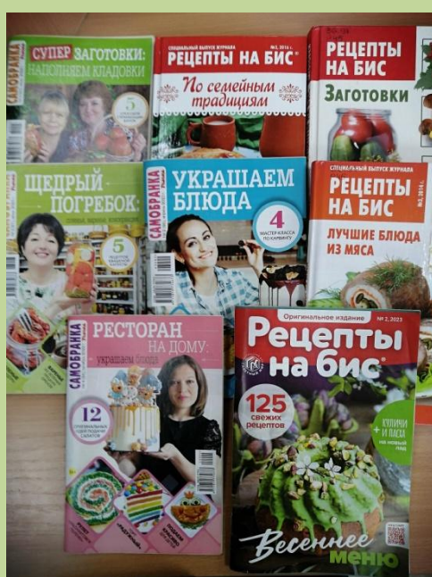
Журналы по кулинарии