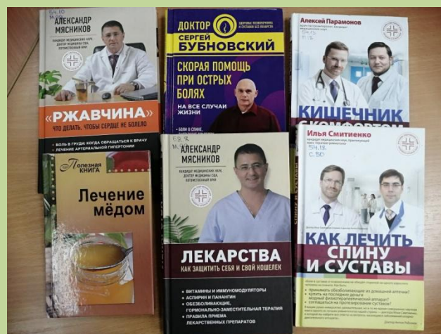
Популярные издания по лечению и оздоровлению организма