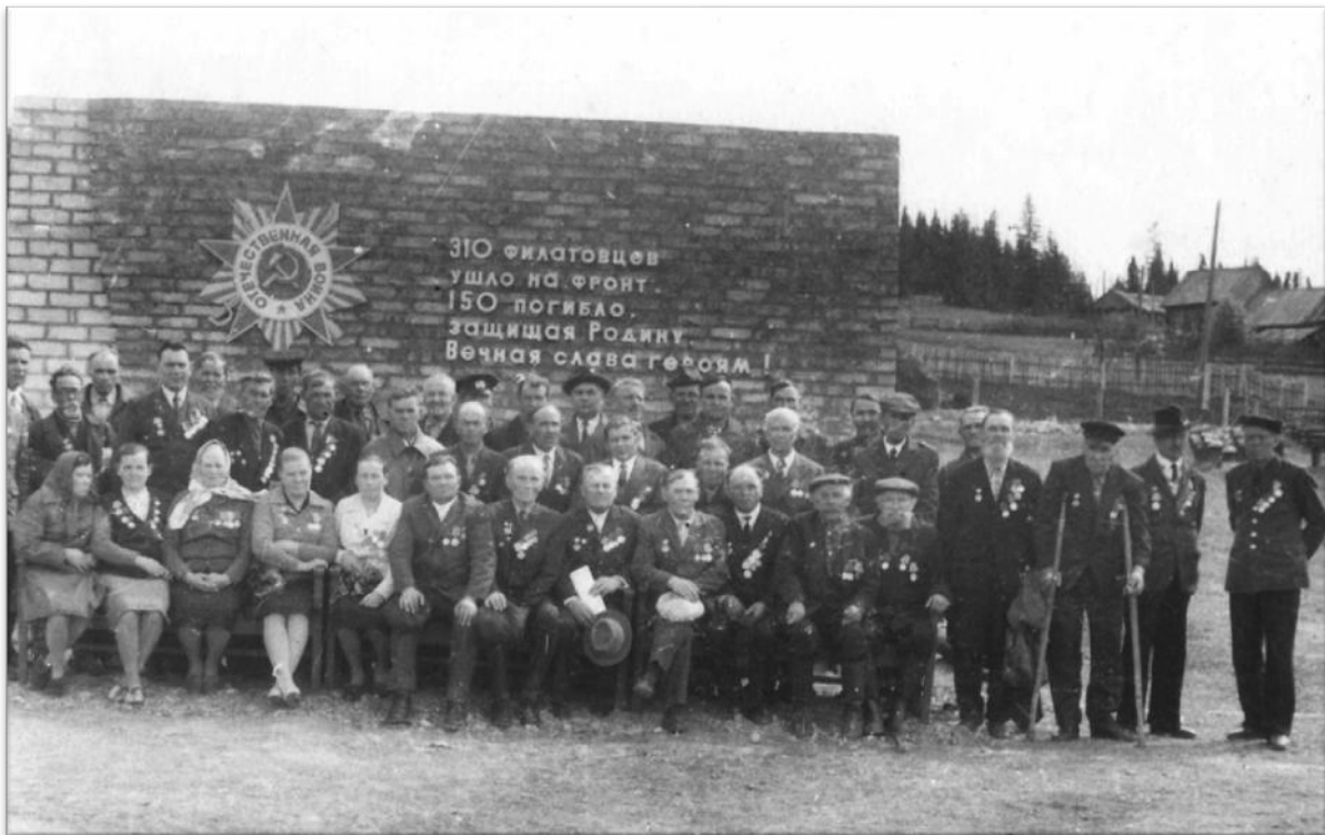
Ветераны Великой Отечественной войны села Филатово

А далее перед всеми присутствующими открывается стела из красного и белого кирпича (автор проекта — В.И. Нечаев). Прибывший из п.Ильинский духовой оркестр под руководством Хренова В.Л. исполняет Гимн Советского Союза.